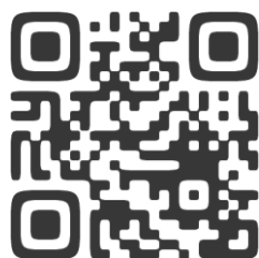
ホームページ QRコード

https://tsukechi-craft.com/ アドレスが変わりました https://www.instagram.com/tsukechi_craft/ https://tsukechicraft.blog.fc2.com/